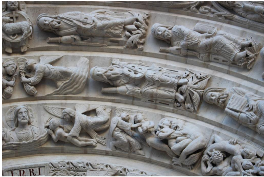
Détail de la voussure interne, côté droit

qu'elle a le contrôle sur elle-même. Elle est toujours enchaînée, selon une formule commune aux possédés et aux pécheurs et exprimant leur servitude. Cette situation sera bientôt abolie puisque l'ange tire à lui la figure. Il est décrit comme médiateur du Verbe divin, parce qu'associé au titulus que tient le Christ et qui s'étend dans cette direction.