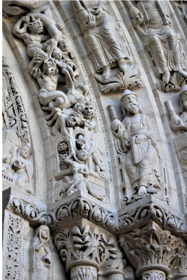
Base de la voussure interne, côté droit (Cl. E. Vernerey)

Elle est à Saint-Denis assez similaire à celle que porte le pénitent en pleine confession de l'un des fragments sculptés de Saint-Léger de Murbach : l'influence du péché y est personnifiée par un diable tenant la corde qui enserre la figure. Ici, le repenté, pareillement au personnage dionysien, attrape le cordage soit pour s'en défaire, démonstration de sa délivrance morale, soit pour la maintenir par participation volontaire au rituel d'humiliation 12 . Sur la voussure, de son autre bras, l'homme porte sa main sur sa poitrine, geste qui évoque peut-être lui aussi la pénitence. La main sur le cœur illustre l'exemption et la contrition, l'aveu de la faute et la reconnaissance de la souveraineté divine 13 .