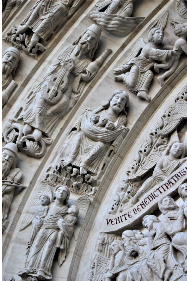
Sein d'Abraham, détail de la voissure interne

Le sein d'Abraham semble là encore évoquer un processus de retour à l'unité enveloppante avec Dieu plutôt qu'un lieu d'attente. La scène paraît en lien avec le titulus que tient le Christ du tympan et qui franchit la frise végétale cerclant celui-ci comme pour indiquer l'impact du Verbe divin sur les figures de la voissure. Comme les ailes des anges qui sont les organes de la descente sur terre, les inscriptions franchissant la frise sont des motifs de médiation entre l'Éternel et l'homme : la parole de Dieu est dépeinte comme perpétuellement active sur le monde. L'inscription, « Venez les élus de mon Père », prolonge le bras de la croix du Christ et permet aux figures d'aboutir au sein d'Abraham établissant un lien décrit par l'abbé Suger :