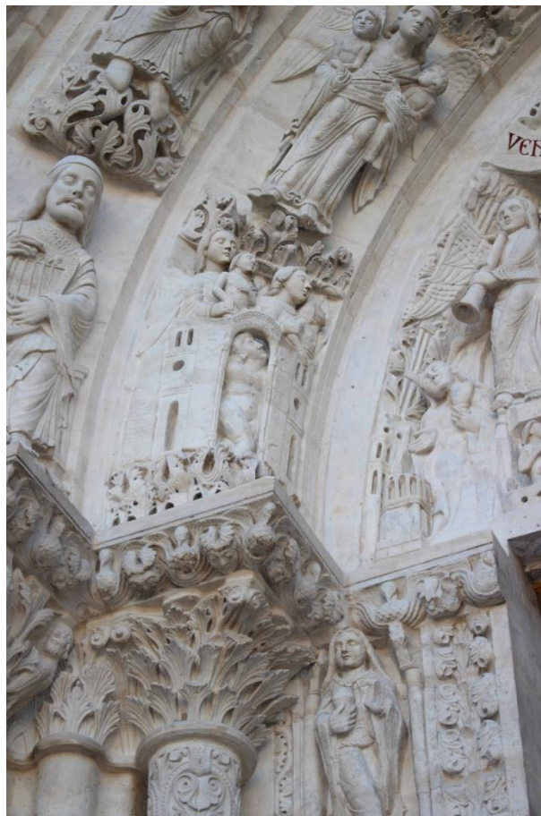
Base de la voussure interne, côté gauche

est béni par le Christ. La répartition à valeur morale des personnages est claire : le côté des justes, à droite du Christ du tympan, s'oppose par les épisodes figurés comme par l'ordonnance des formes, structurées et symétriques, au désordre et aux malheurs des figures de l'autre côté. Toutefois, l'identification à un seul thème, celui du Jugement dernier, semble pouvoir être remise en cause. Plusieurs scènes paraissent, en effet, faire directement référence à la liturgie et à l'Église contemporaine. La situation des figures témoigne d'une évolution spirituelle suivant la forme ascendante de l'arc. L'idée de progression tranche avec la thématique d'une répartition finale, par définition irrémédiable. Les références à la liturgie terrestre, elles aussi, s'inscrivent en faux avec le seul Jugement dernier.